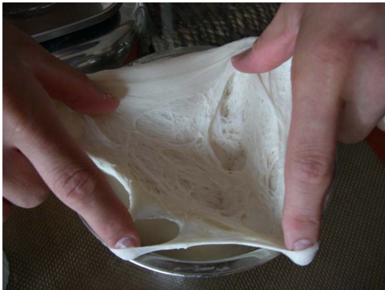
表面を裂いてみると、網目状組織が。

さて、次の日です。生地はさらに膨れ上がり、ぷくっとしています。 一晩寝かせることによって、この生地の中にはたくさんの酵母が増殖しています。